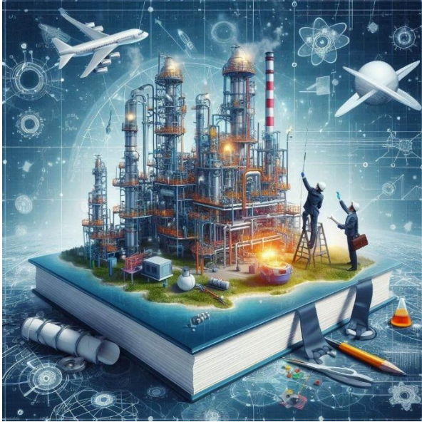
Imagen generada con Bing