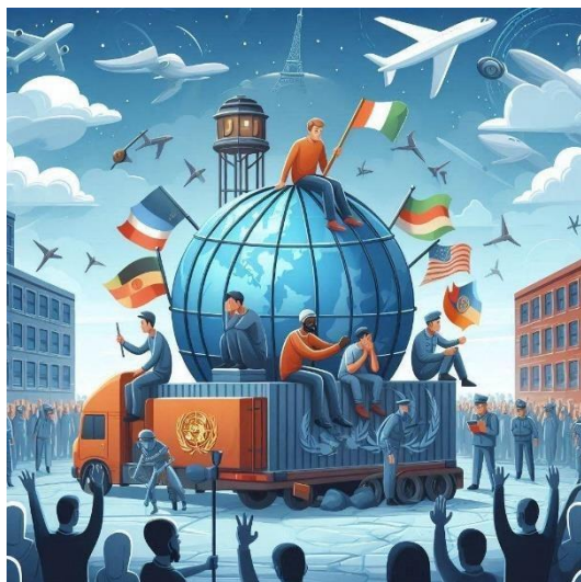
Imagen generada con Bing