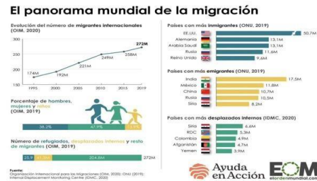
Gráfica 1. El Panorama Mundial de la Migración.

Extraída de la Radiografía hecha por el Orden Mundial (Merino, 2021)