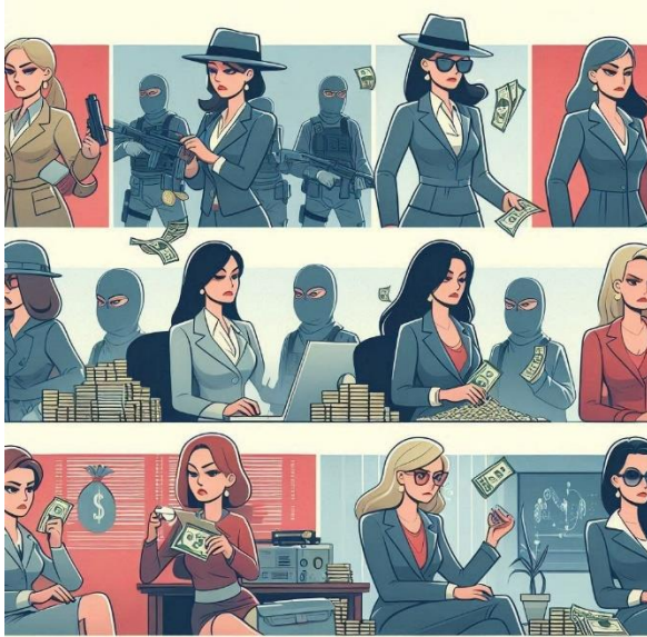
Imagen generada con Bing